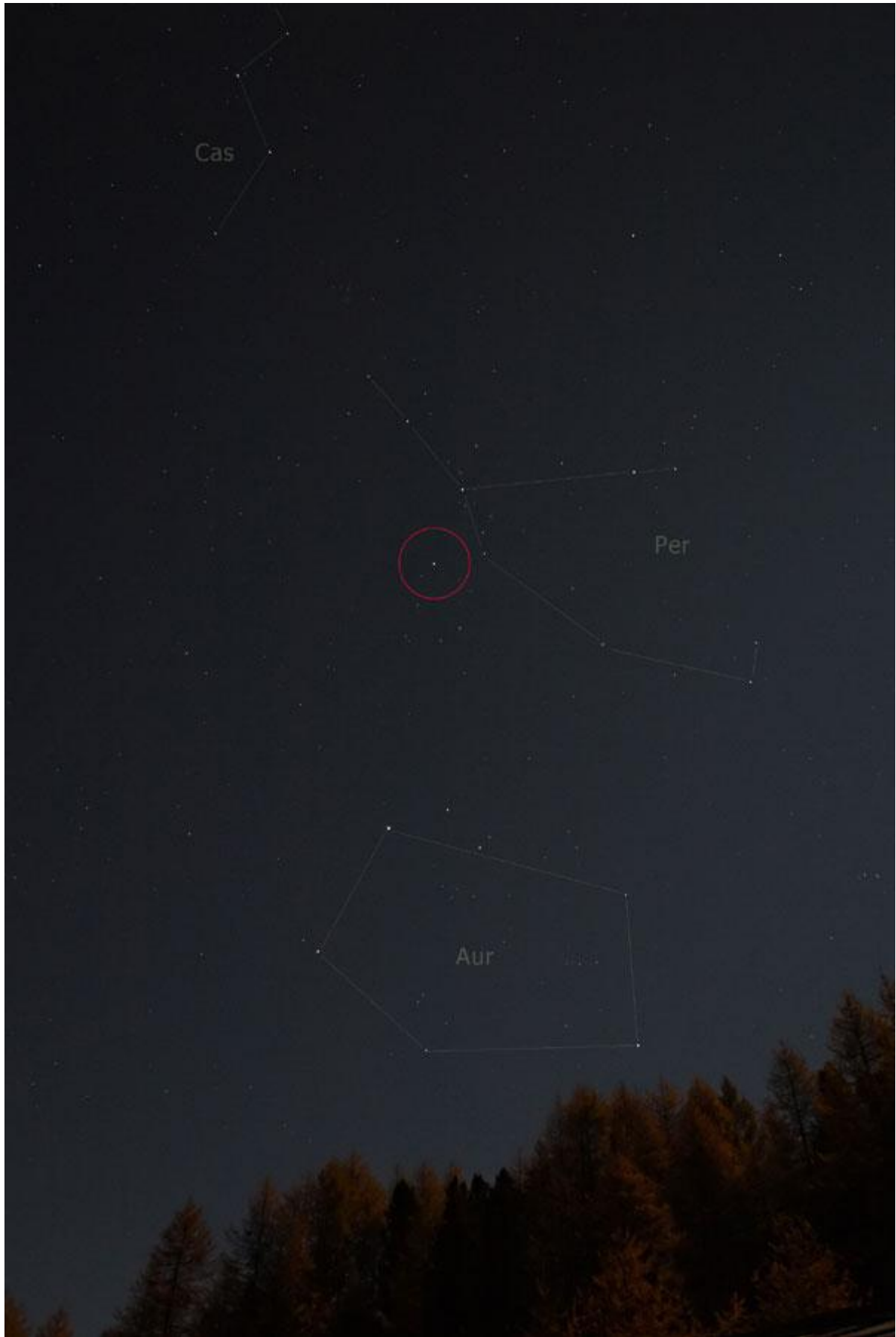
Komet Holmes ist relativ einfach im Sternbild Perseus nahe dessen Hauptstern Mirphak zu finden [Peter Heinzen]