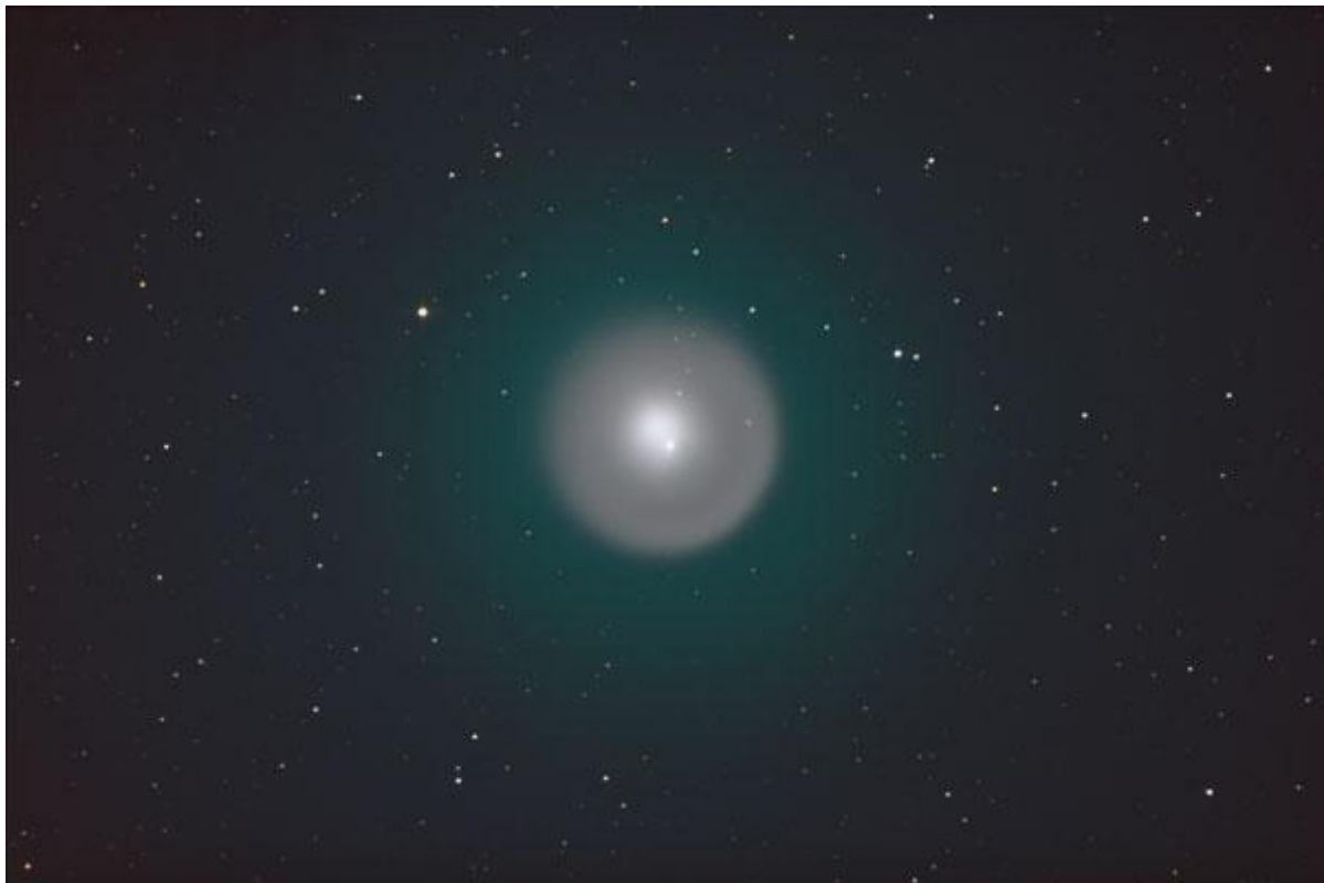
Komet Holmes am 29.10.2007 um 19:45:00 MEZ, 16"-Newton bei 1800mm, EOS 350Da, ISO 800, 4x60s, 10x5s

Es ist die Kometenüberraschung des Jahrzehnts: Der periodische Komet 17P/Holmes, bis zum 24.10. noch ein unscheinbares Objekt von 19. Größe und höchstens im Fokus von Spezialisten, hat innerhalb von wenigen Stunden einen dramatischen Helligkeitsausbruch erlitten, wie er in der Geschichte der Kometenbeobachtung ohne Parallele ist. Derzeit steht Komet Holmes mit 2. Größe nahe alpha Persei alias Mirphak im Sternbild Perseus und ist der einfachste mit bloßem Auge sichtbare Komet seit Hale-Bopp 1997.